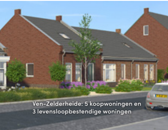
Ven-Zelderheide: 5 koopwoningen en 3 levensloopbestendige woningen