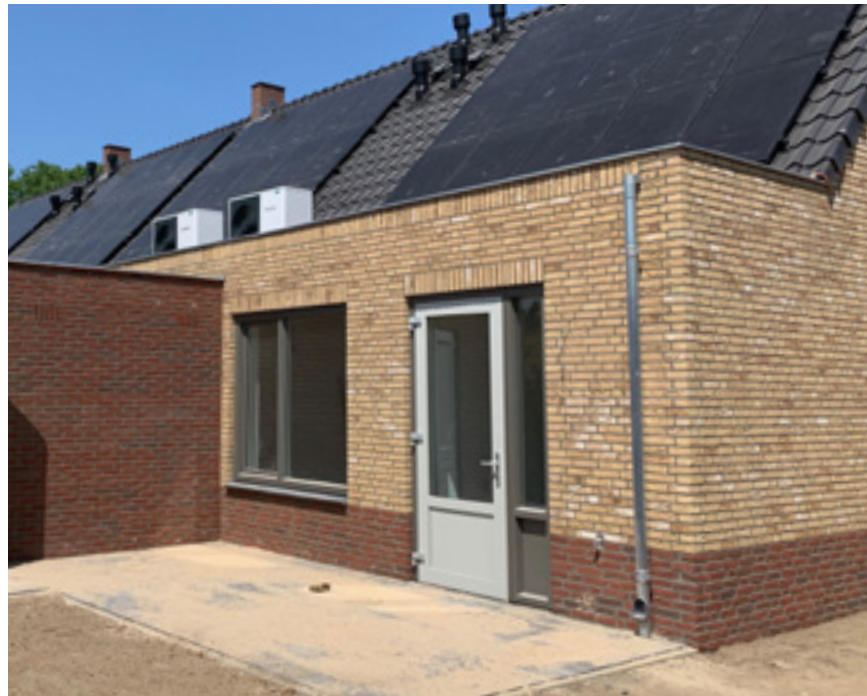
De buitenunit van de warmtepomp kan op verschillende plekken bij of tegen de woning worden geïnstalleerd