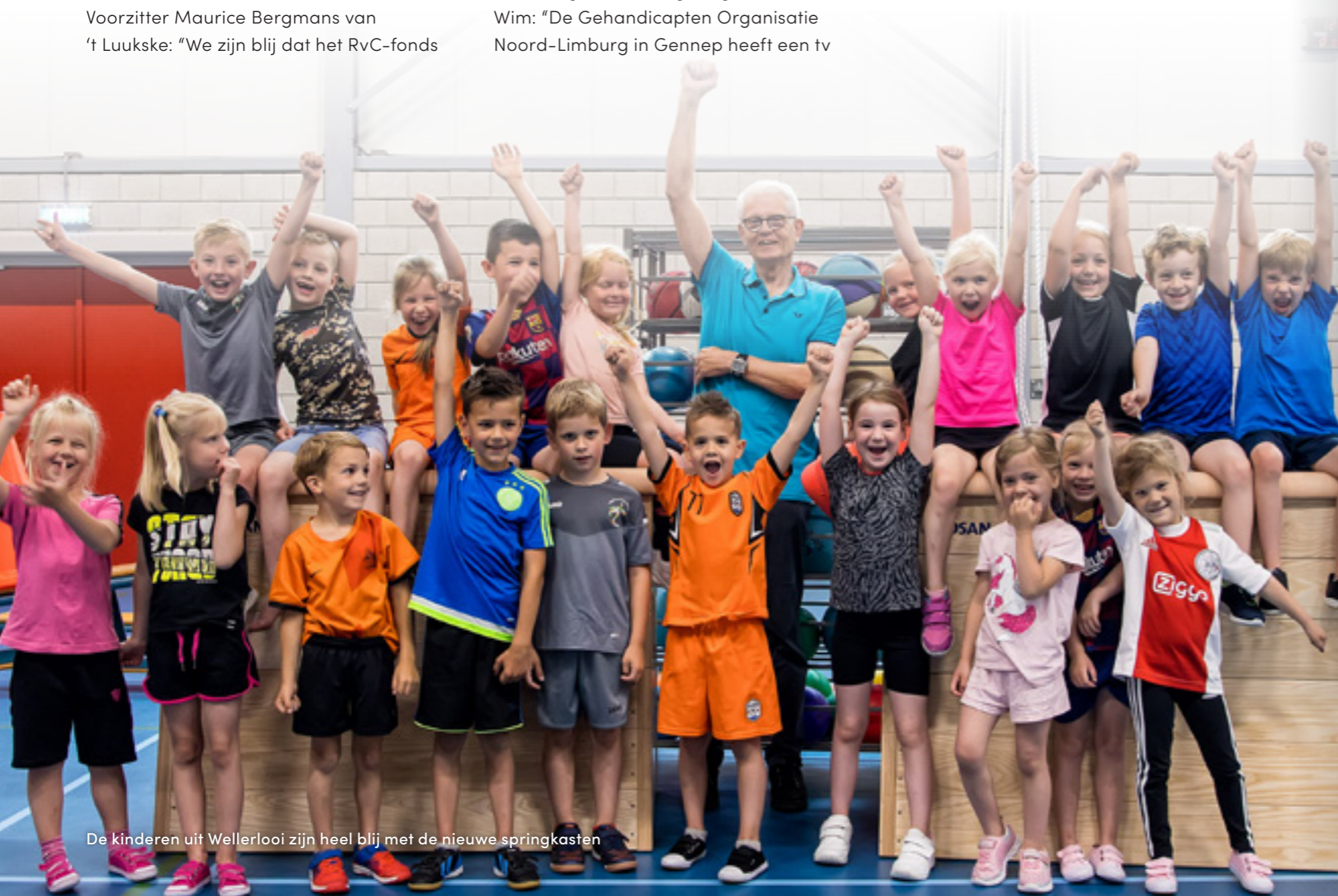
De kinderen uit Wellerlooi zijn heel blij met de nieuwe springkasten