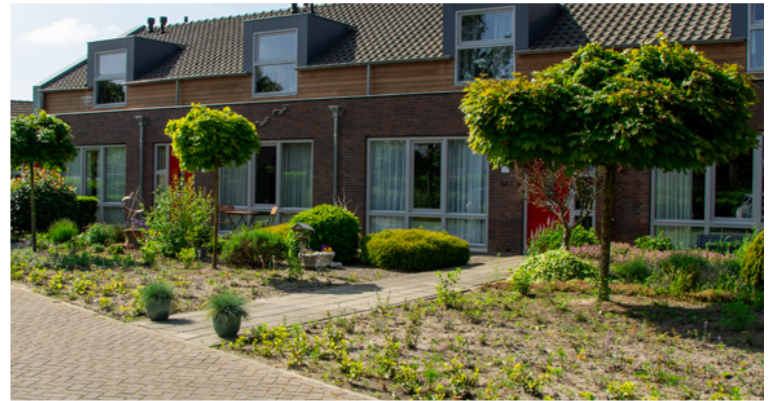
Op de Kaar in Ottersum is bestrating weggehaald en zijn perkjes gemaakt om te vergroenen