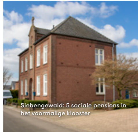
Siebungewald: 5 sociale pensions in het voormalige klooster

Destion blijft vernieuwen. Op deze pagina ziet u de bouwprojecten waar op dit moment aan wordt gewerkt.