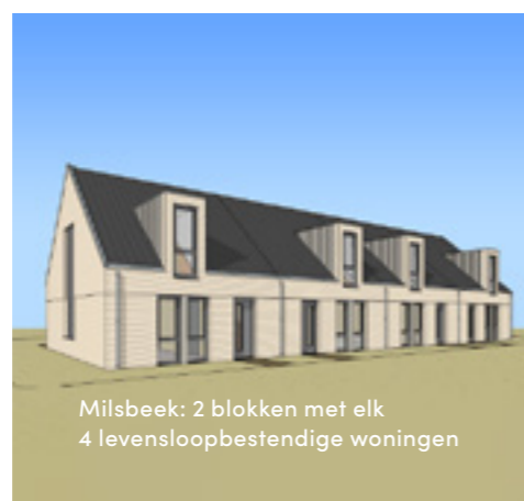
Milsbeek: 2 blokken met elk 4 levensloopbestendige woningen