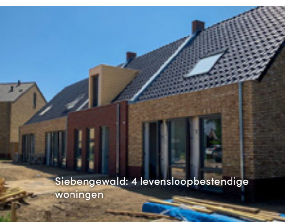
Siebungewald: 4 levensloopbestendige woningen