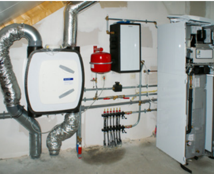
De binnenunit van de warmtepomp wordt meestal geplaatst op de plek waar ook de cv-ketel staat